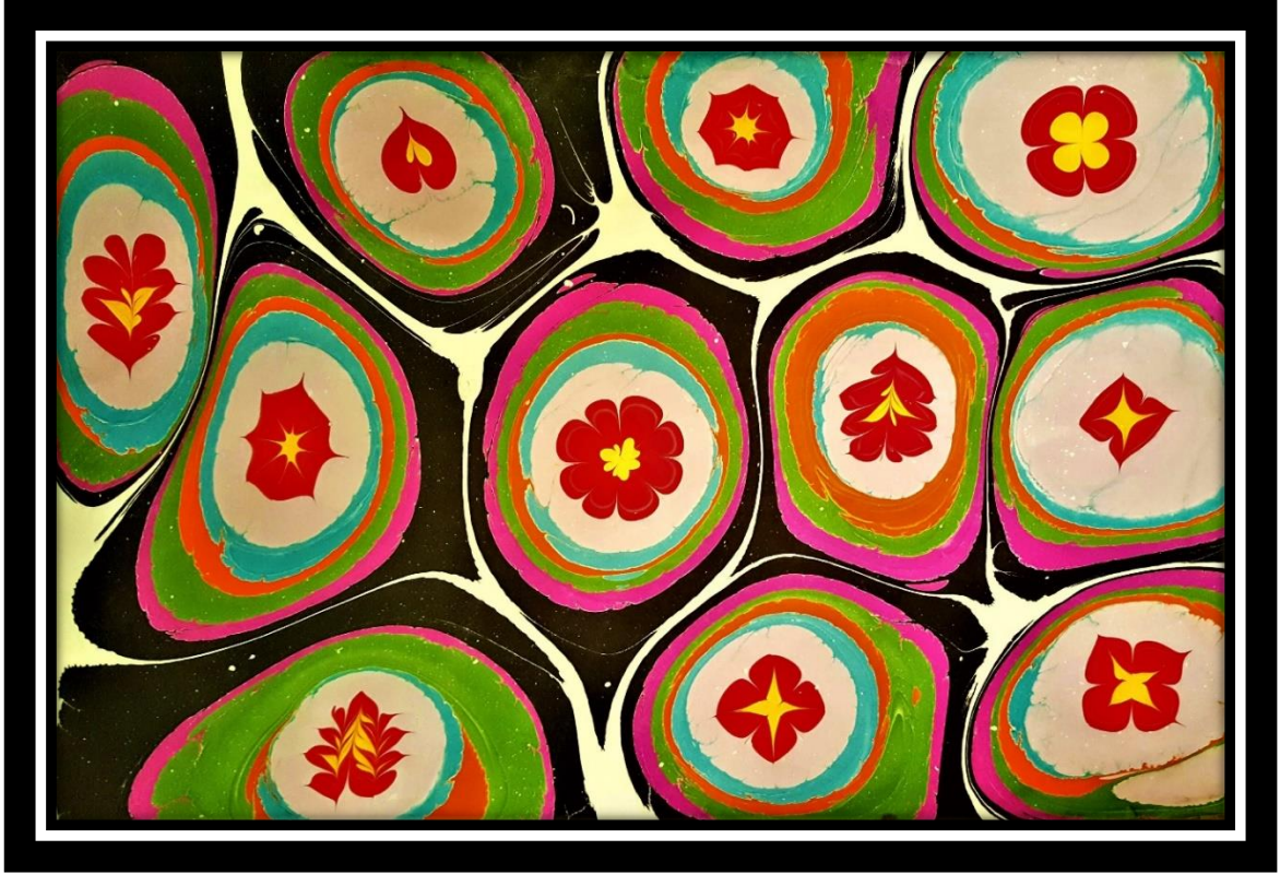
Şekil 4. Tahsin Bozdağ'ın Ebru Çalışması