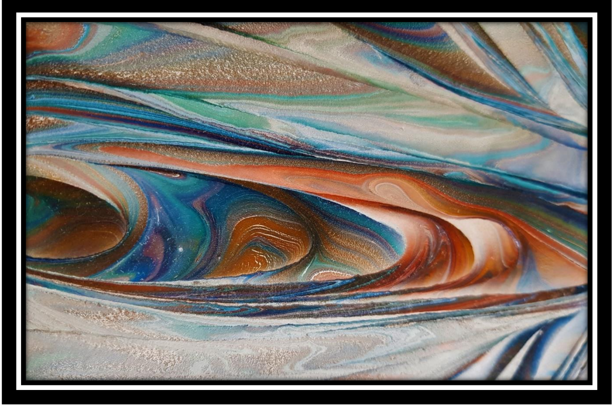
Şekil 6. Tahsin Bozdağ'ın Ebru Çalışması