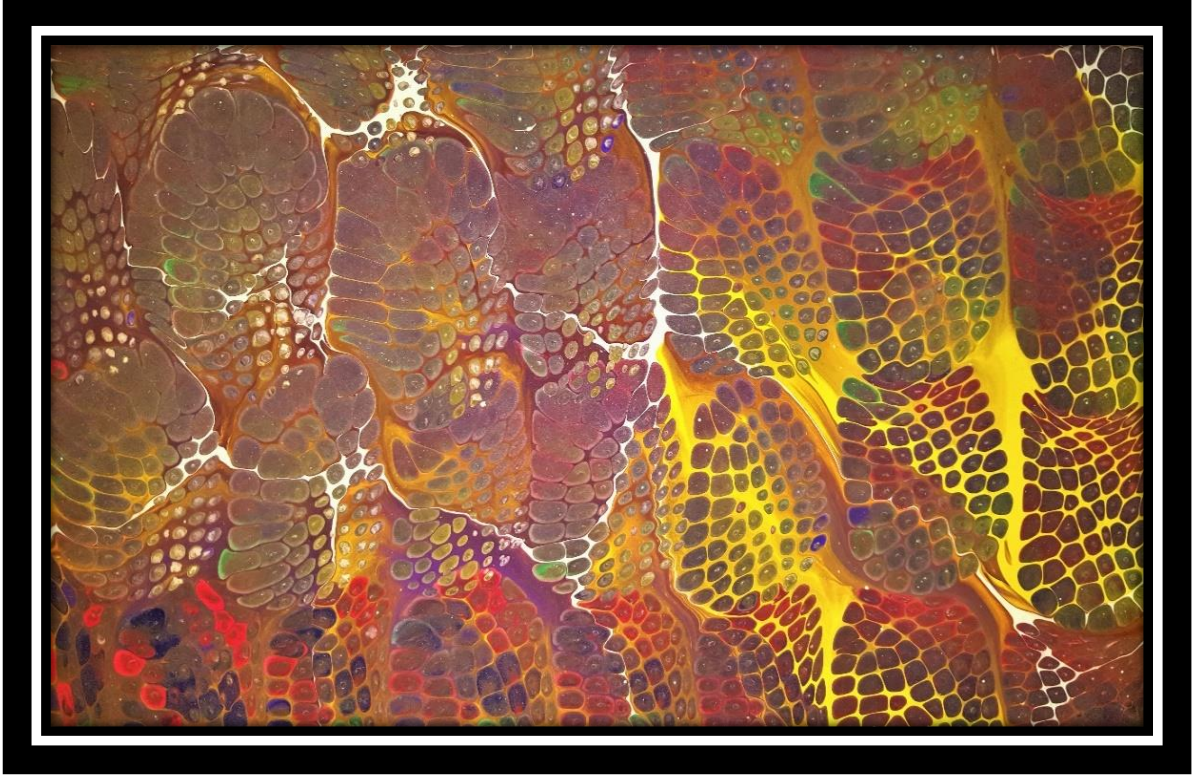
Şekil 2. Tahsin Bozdağ'ın Ebru Çalışması