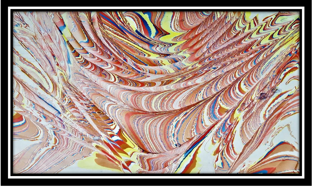
Şekil 3. Tahsin Bozdağ'ın Ebru Çalışması

Geleneksel Türk ebru sanatçısı içinde bu salt sorular sanatçının zihin ve ruh sanrılarının ne kadarını meşgul ettiği giderek artan bir şekilde, belirli durumlarda meydana gelen karmaşık süreçler açısından araştırılmaktadır. Ebru sanatçısı teknede icra edilen bir ebrunun yaratıcı çıktısı önemli olarak kabul edilirken, sanatçının giderek daha fazla ilgisini çeken çıktının üretilmesinde yer alan salt bilişler ne kadar etkili bir süreçtir [5]. Bu sürece iki boyutlu düzlemin katkısı ve renk değerlerinin ebrunun icrası için duyuşsal alanın katkısı yadsınamaz. Bilişsel yordama sürecinin çeşitli seviyelerine odaklanma nasıl işlediğine dair anlayışı genişletmek için önemli ancak yine de yaratıcılığın düşünme süreci teknede ne kadar etkili olacaktır [6]. Bu süreci Şekil 4'teki ebru örneği ifade us ideasından biçimselliğe taşımaktadır.