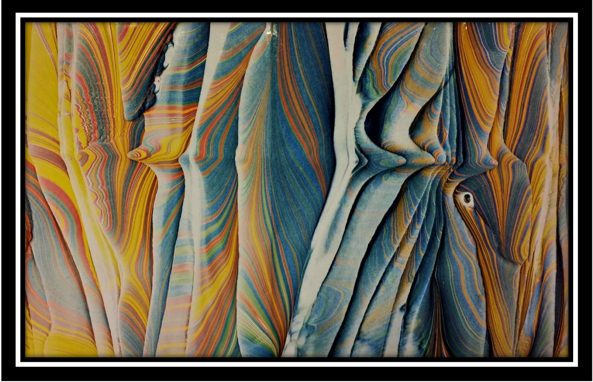
Şekil 1. Tahsin Bozdağ'ın Ebru Çalışması

Gelenekli sanatlardaki duyuşsal alanda salt biliş çalışmaları ve bu konu içeriđi kapsamında ele alınan başlıklar incelendiđinde çalışmaların genellikle kreatif düşünme süreçleri ve eserdeki tekniklerin geliştirilmesi konuları dar bir perspektifte araştırmıştır [1]. Geleneksel Türk ebru sanatının somutlaşmış boyutları, kısmen, duyuşsal alanda incelenen birçok sanatın alt elemanları için somutlaştırılmış ve gelenekli sanatlarında varoluşsal sınırların sanatçı usu anlam boyutu bağlamında zorluğu nedeniyle, üzerinde durulmayan bir çalışma dizisi olarak kalmıştır. Usların salt elemanlarını Şekil 1'deki gelgit ebru çalışması iki boyutlu düzlemin usu olarak algılanabilir.